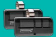
Control remoto MAX de 3 botones (893MAXLMK)