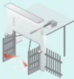
Abatible hacia fuera