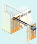
Abatible hacia dentro