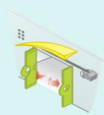
Plegadiza hacia fuera